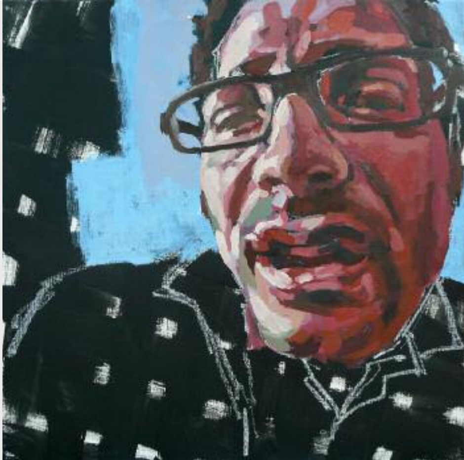
"Sounds", 2009, Acryl und Öl auf Leinen, 50 x 50 cm

Der Modellbeitrag ist von der Teilnehmerzahl abhängig.