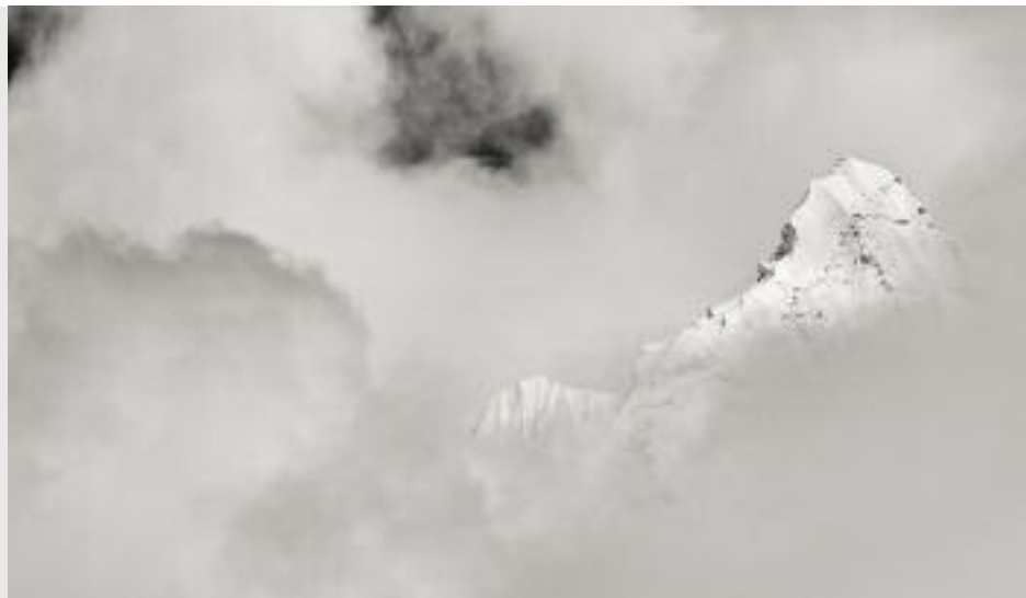
"Der fliegende Berg", 2008, Fotografie, Pigmentprint auf Barytp., 40 x 60 cm