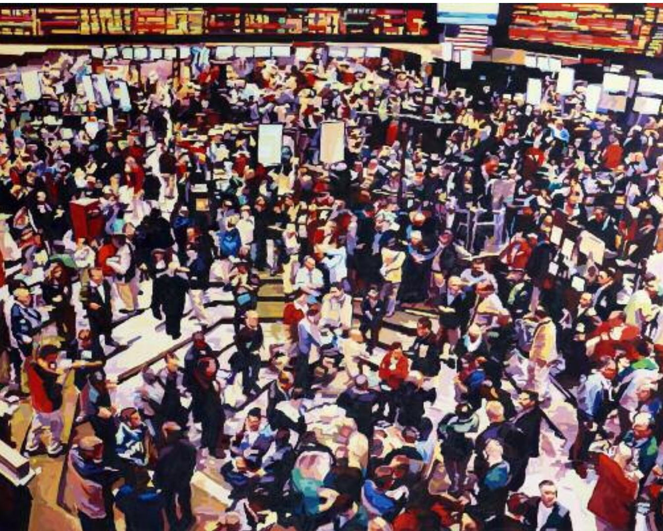
"Chicago Board of Trade", 2008 - 09, Öl auf Leinwand, 180 x 240 cm