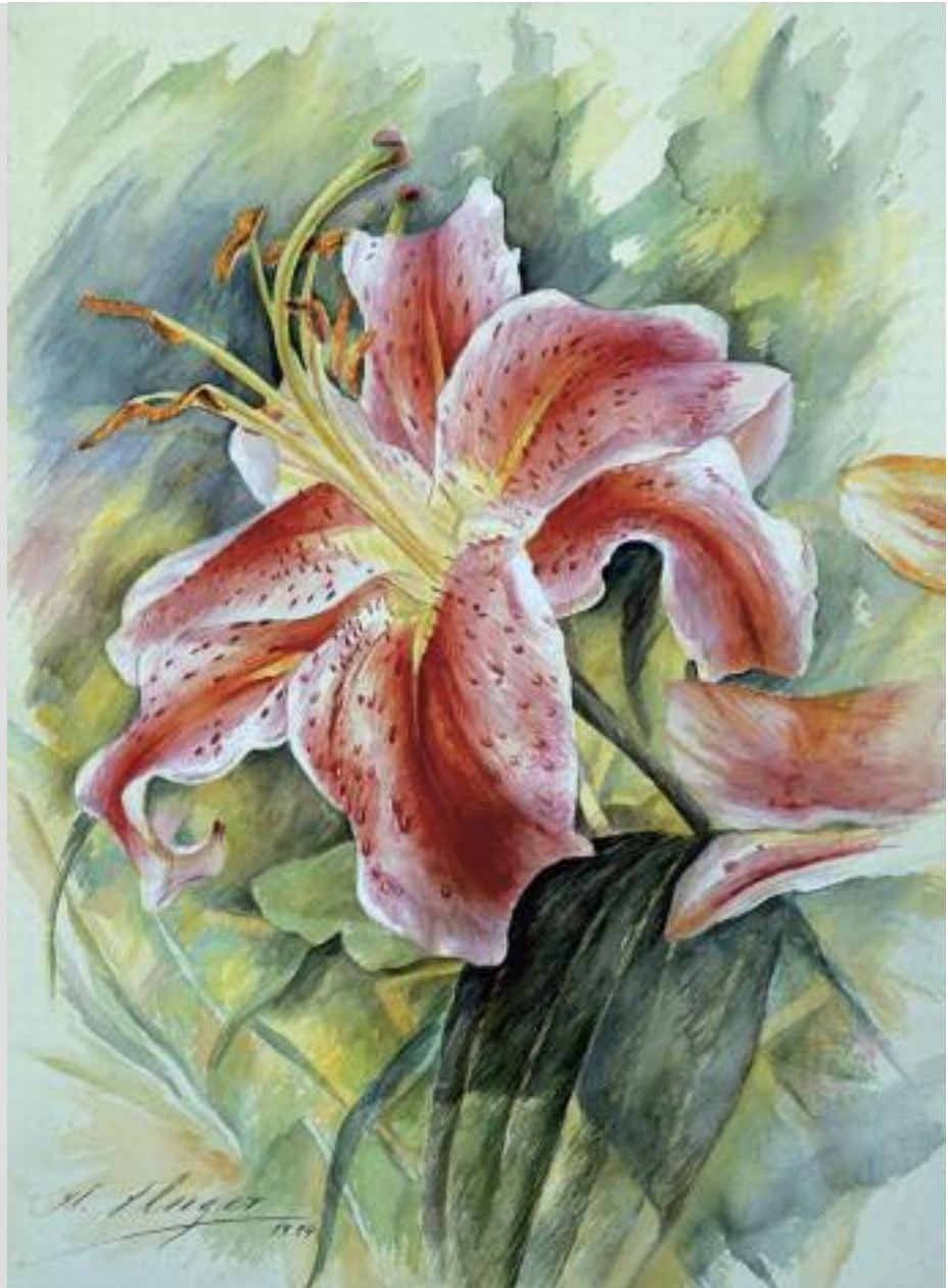
"Voll erblüht", Aquarell, 48 x 64 cm