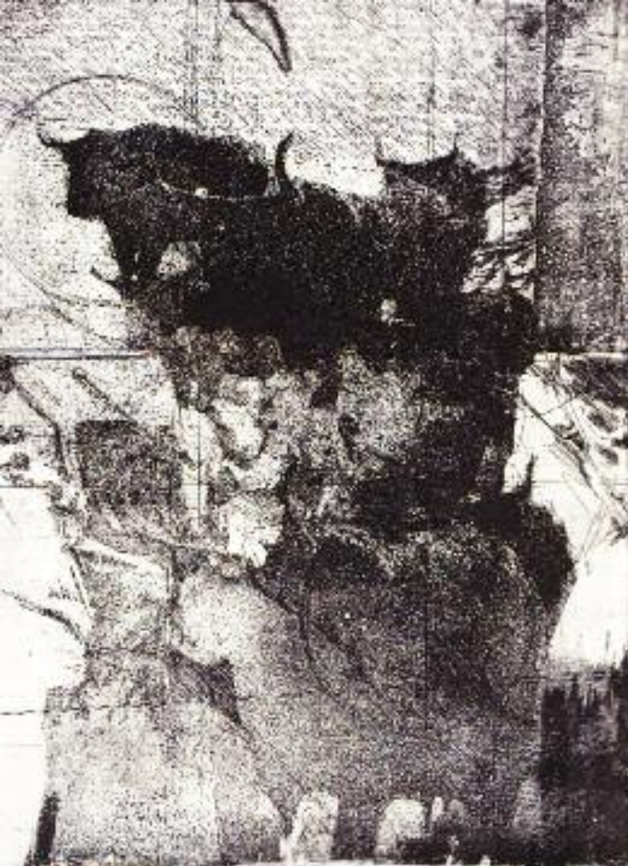
"Lavorazione - Verarbeitung I", 2009, Fotoradierung, Aquatinta, ca. 29 x 23 cm