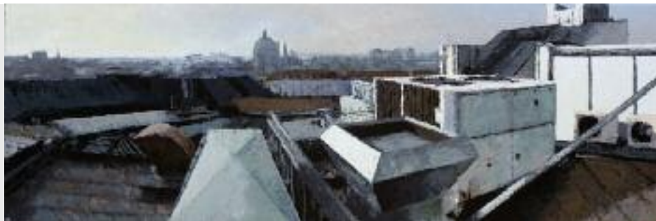
"Vedute I/2009", 2009, Öl auf Leinwand, 60 x 180 cm