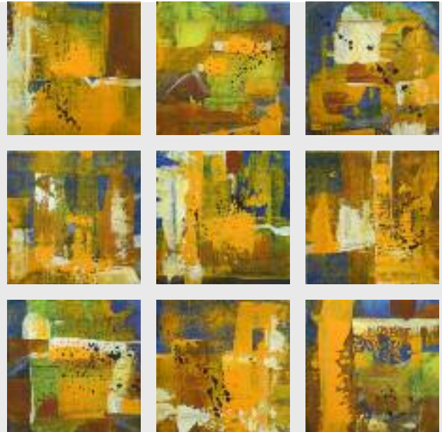
o.T., 2009, Acryl/Leinwand 9 Teile, je 15 x 15 cm