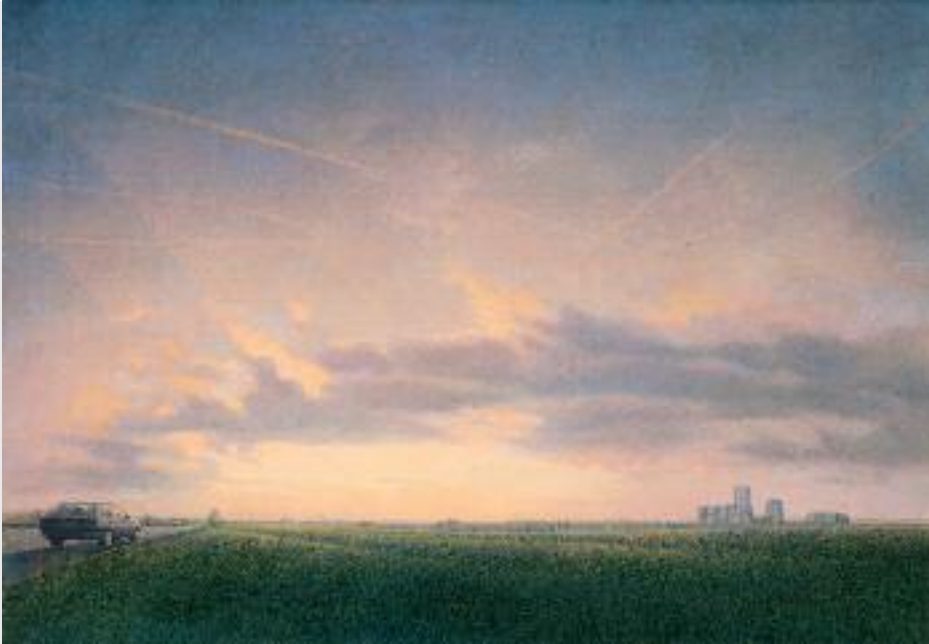
“Fernweh”, Öl-Lasurmalerei, 70 x 100 cm

1946 geboren in Dresden, übersiedelt nach Österreich. 1968 - 1972 Studium an der Akademie der Bildenden Künste in Wien, Meisterklasse Prof. Rudolf Hausner, Diplom für Malerei. 1978 Lehramtsprüfung. 1975 - 2002 Lehramt an verschiedenen Schulen in Wien, Niederösterreich und Deutschland. 1980 - 1982 Stipendium für Japan - Studium japanischer Maltechnik an der Tokyo Geidai. Beschäftigung mit Videofilm. Von 2000 - 2005 künstlerischer Leiter der Galerie Akum in Wien. Zahlreiche Ausstellungen in Österreich, Deutschland, Italien, Portugal und Japan. Publikation: 3 Werkkataloge, Veröffentlichungen in Kunstzeitschriften u. v. a.