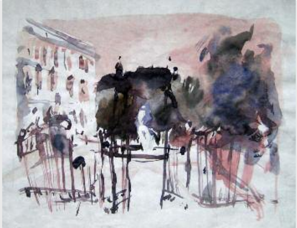
"Salzburg", Aquarell, 34 x 25 cm