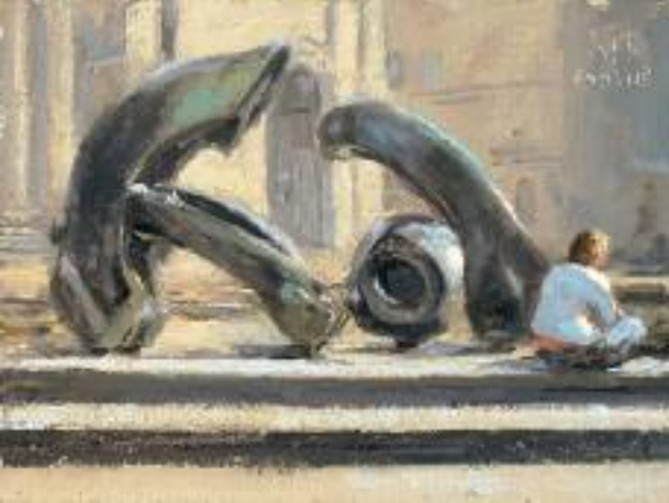
“Moore Skulptur”, 2008, Öl auf Malplatte, 18 x 24 cm