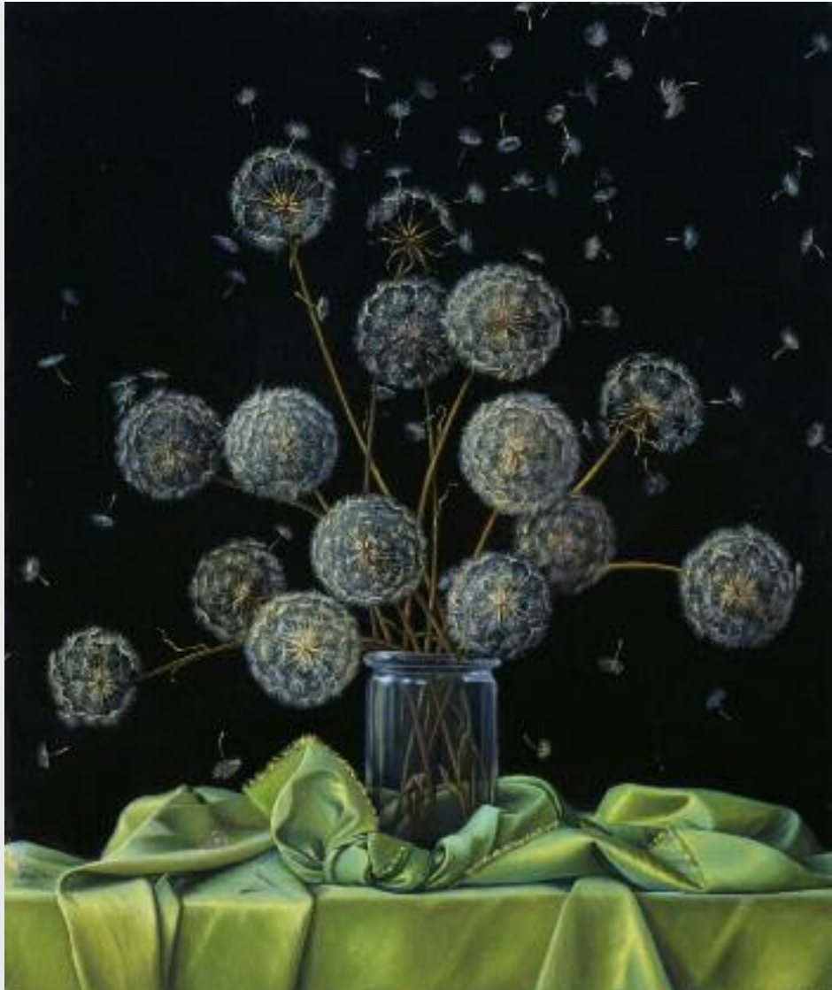
"fffff", 2009, Öl und Eitempera auf Holz, 50 x 42 cm