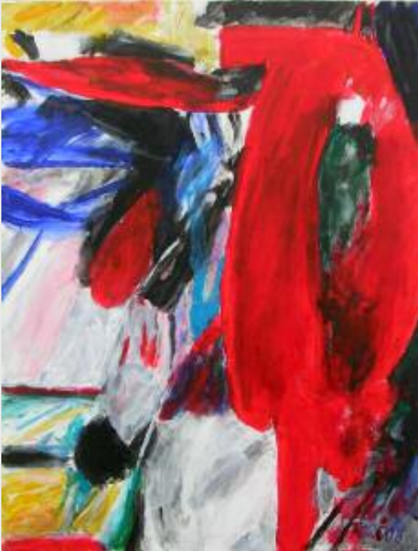
"Menetekel", 2008, Acryl auf Leinwand, 130 x 100 cm