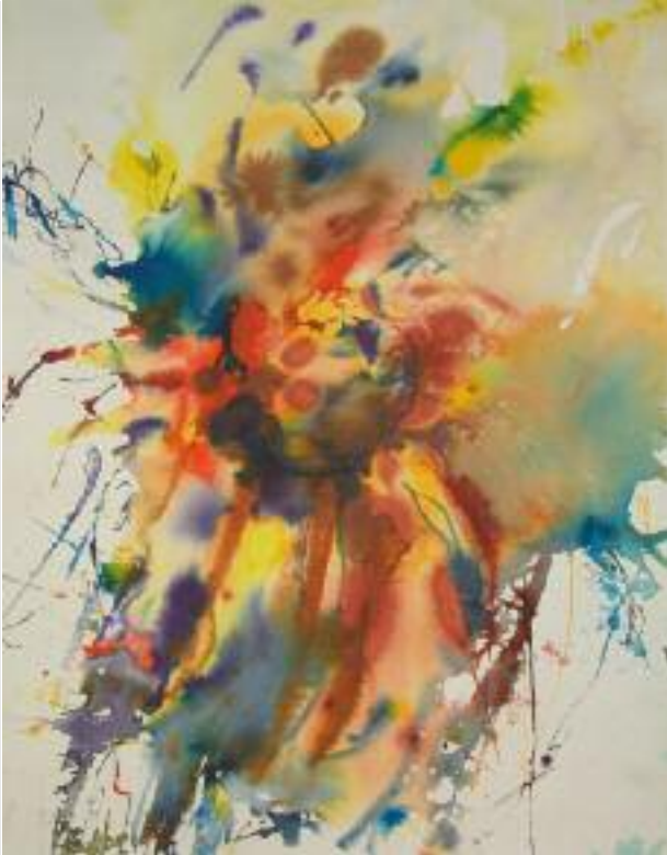
"Blüten", Aquarell, 40 x 60 cm