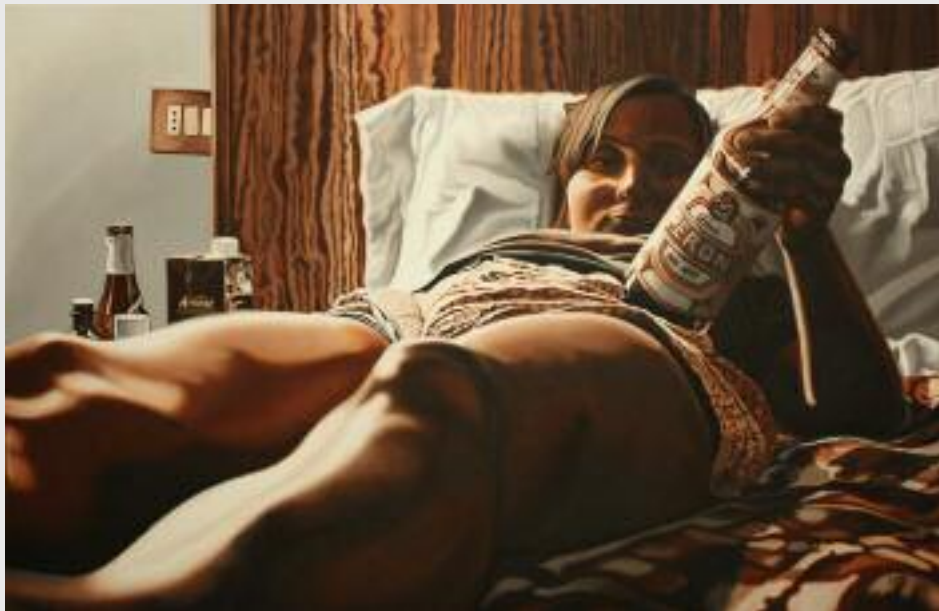
"Birra", 2005, Öl/Leinwand, 85 x 130 cm

max. 14 Teilnehmende Kursbeitrag: € 310,- Kurs 29 + Kurs 30: € 420,-