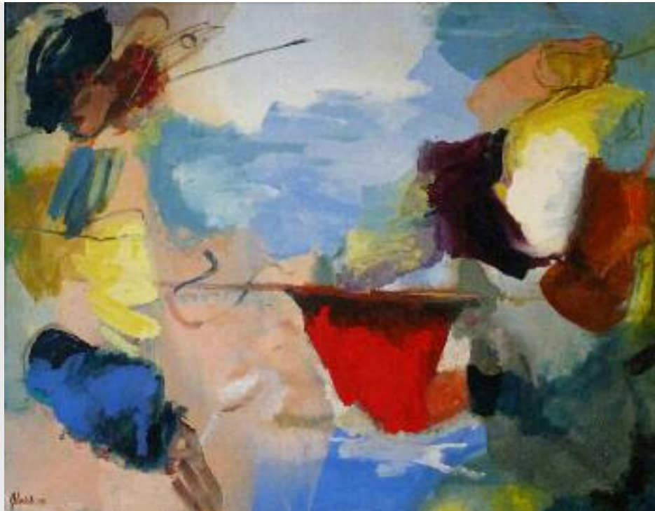
T 21 "Nach Tiepolo", 2008, Öl auf Leinwand, 200 x 250 cm