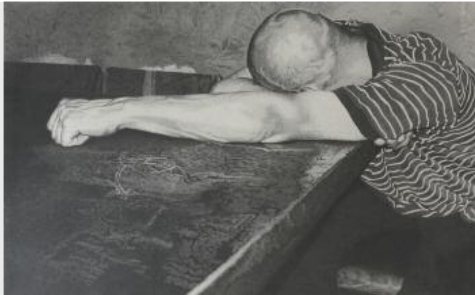
"Schlafender Satyr IV", 2007, Bleistift auf Papier, 35,5 x 57 cm

Folgende Kurse sind für all jene geeignet, die sich kreativ und auf zeichnerische Art und Weise mit ihrer Umwelt auseinandersetzen wollen.